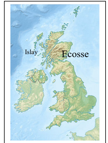
Carte du Royaume Uni

Corryvreckan signifie "chaudron du plaid" en gaélique. Des excursions au niveau du tourbillon généré par le fort courant sont proposées pour les touristes les plus téméraires.