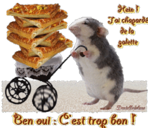
Extrait de kiniou 1970 blog