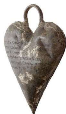
reliquaire contenant le coeur embaumé de son mari