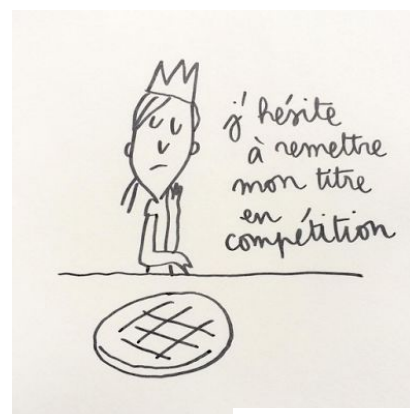
Extrait de pinterest bricolage