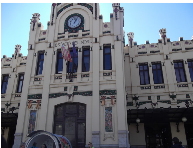
Estación del Norte, Valencia

Ce fût 1 heure du pique-nique devant la Estación del Norte , l'équivalent de la Gare du Nord, en quelque sorte. Et dans le pique-nique, Ô surprise : un sandwich, énorme ! Une baguette entière, énorme ! Une pomme, énorme ! Et une bouteille, toute petite. Sur le chemin, nous avons traversé un grand parc duquel on a pu apercevoir el Palau de la Música , un opéra de Valence.