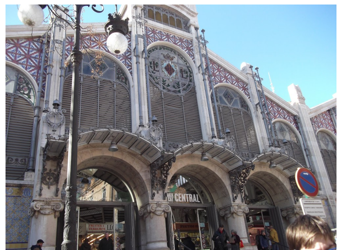
Mercado Central, Valencia