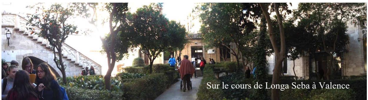
Sur le cours de Longa Seba à Valence

Les délégués de toutes les classes et les élèves du conseil de vie collégienne de 3è seront reçus à l'assemblée nationale le 7 Juin après